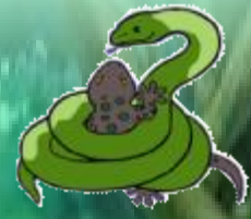
งูรัดตุ๊กแก

๑. เหลือ้ม (โทโทษของ “เหลือ้ม”) (ว.) หมายถึง