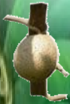
ต้นหัวลิง