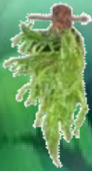
ชื่องนางคลี่