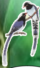
นกสาติกา