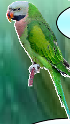
นกแขกเต้า