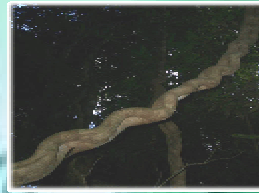
กระไดลิง