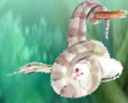
งูรัดหนู