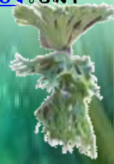
สไบนางสิตา